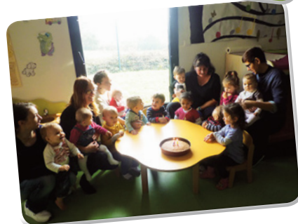
Gâteau d'anniversaire VARENNES/A