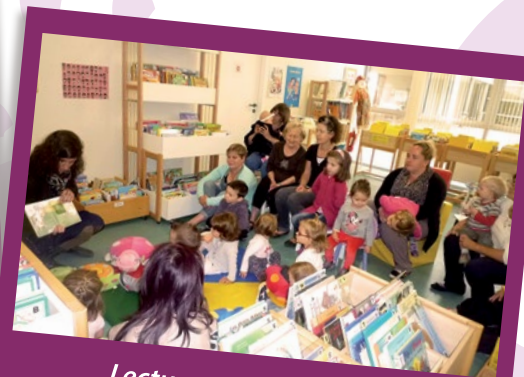
Lectures pour les petits