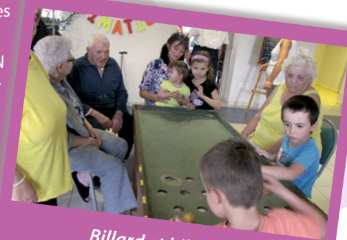
Billard et bilboquet