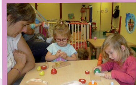
...et jeux d'encastresments