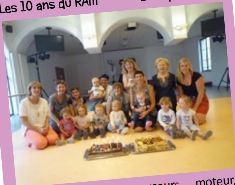
Les 10 ans du RAM 10 septembre

Matinée ludique: parcours moteur, concours de dessin, expos des créations des enfants. L'après-midi spectacle et goûter pour souffler les bougies.