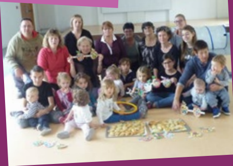
Journée du Goût 21 octobre

Journée autour de la pomme : réalisation de chaussons aux pommes dégustés pour le goûter et réalisation de pommes cartonées.