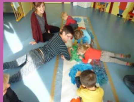
Animation avec la crèche 13 novembre

Fresque magique avec de la peinture plastifiée. Les enfants ont pu marcher, sauter dessus sans se salir!!