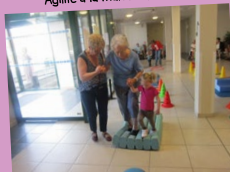
Agilité à la maison de retraite

Le 9 Décembre, les enfants ont partagés une matinée avec les résidents pour faire un parcours motricité ensemble.