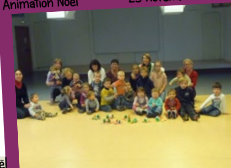
Animation Noël 25 novembre

Les enfants ont décoré une étoile, des sapins, une bougie et des boules en peinture puis la journée s'est terminée par un goûter.