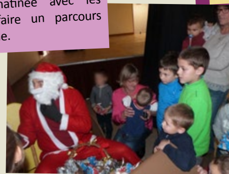
Spectacle de Noël

Le père Noël est venu dans son traineau en apportant des gourmandises pour les enfants. Après le spectacle, tout le monde s'est réuni autour du traditionnel goûter.