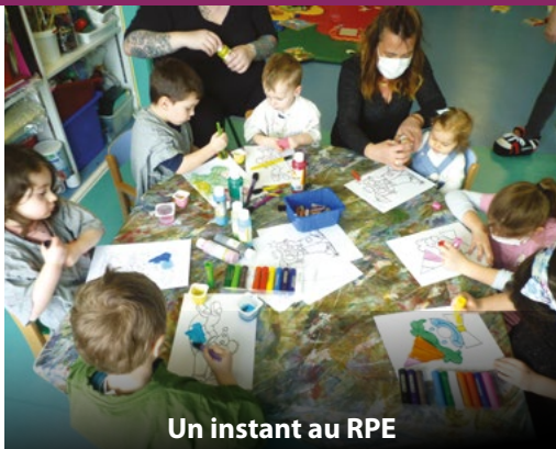
Un instant au RPE